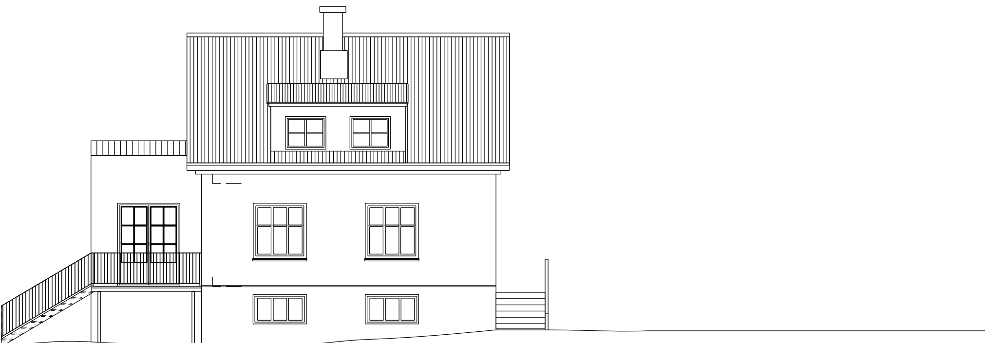
Útlit austur mkv. 1:100