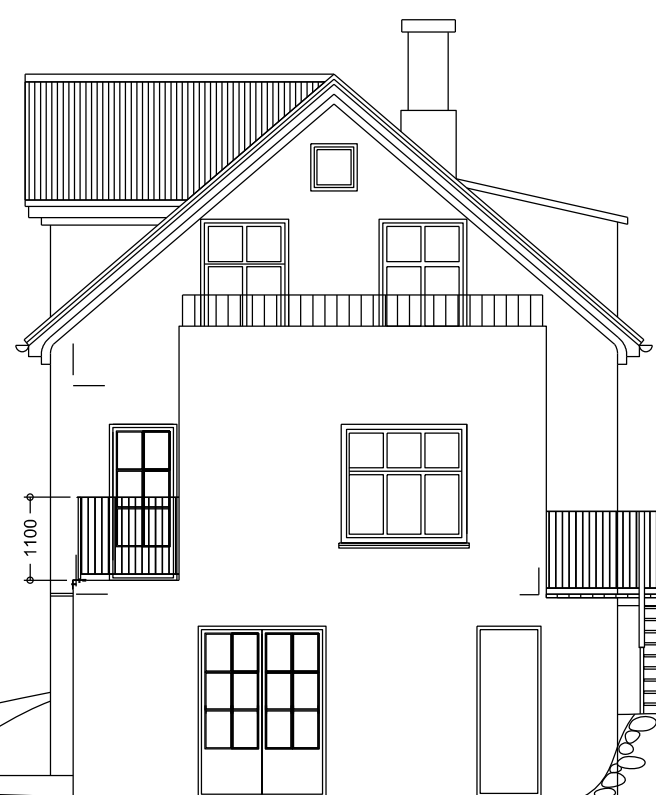
Útlit suður mkv. 1:100