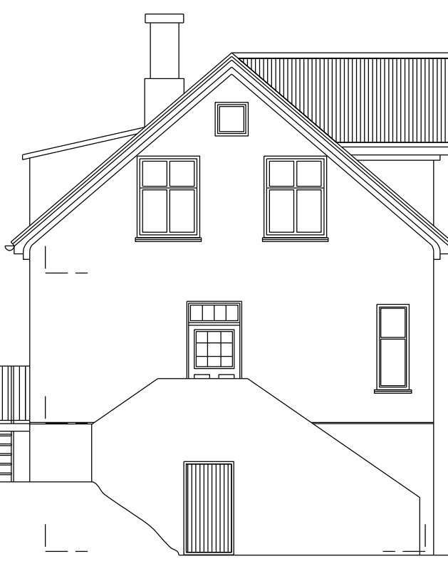
Útlit norður mkv. 1:100